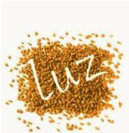
Beste Mehle aus regionalem Getreide (Münsingen-Buttenhausen)