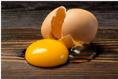
Eier Hof „Wiech“ (Tübingen-Hageloch)